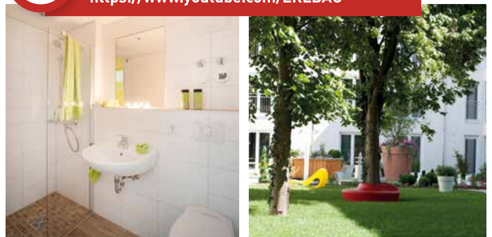
Außenansicht Studenten-Apartements Ingolstadt