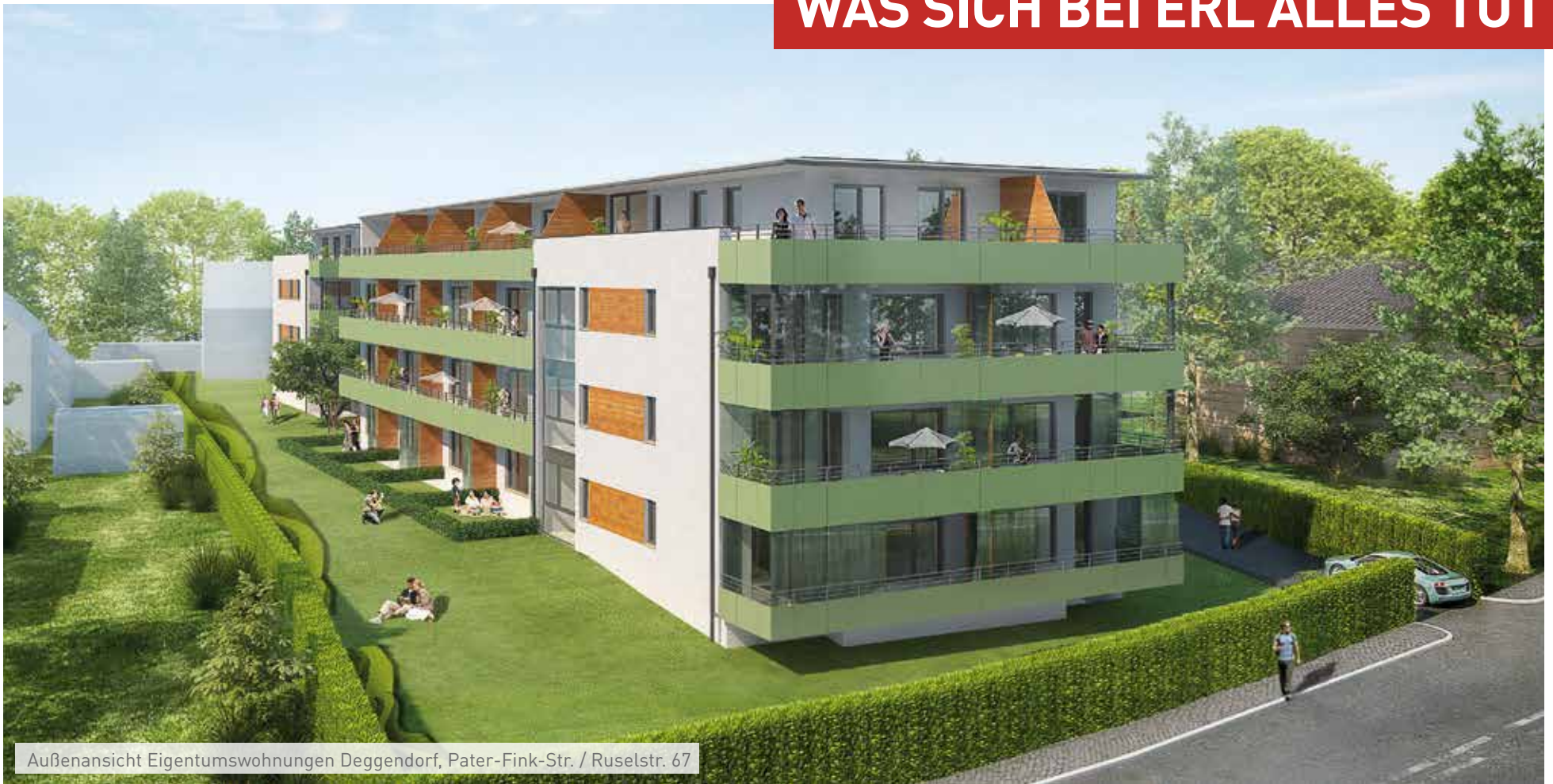
Außenansicht Eigentumswohnungen Deggendorf, Pater-Fink-Str. / Ruselstr. 67